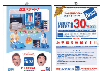
①アート引越センター様 両面掲載見本