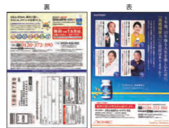
サントリーウェルネス様 両面掲載見本