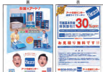
アート引越センター様 両面掲載見本